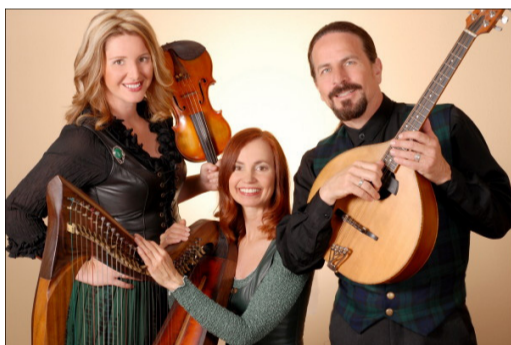
Golden Bough, 30.09. 20.00h