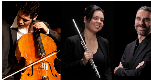
Trio Lumimare 05.05. 20.00h