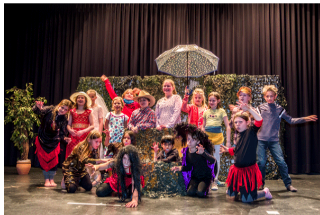
„TanzVampire“ 31.05. 17.00h