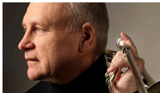
Raging Bones 18.05. 20.00h